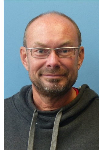
Frau May (Berufseinstiegsbegleiterinnen)